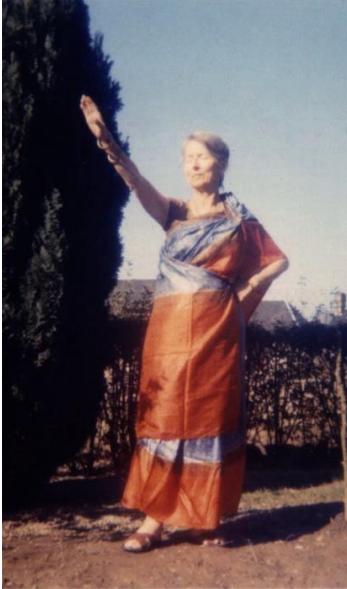
Savitri Devi (Frühjahr 1971)

Pio: Savitri Devi sagte etwas, von dem ich denke, dass es sich lohnt, darüber nachzudenken: "Eine Zivilisation, die ein so lächerliches Aufheben um angebliche Kriegsverbrechen oder Gewalttaten gegen die Feinde der eigenen Sache macht, aber Schlachthäuser, Tierversuche und den Zirkus oder die Pelzindustrie toleriert, verdient es nicht zu leben" . Ich könnte diesem Zitat auch noch die Abtreibung hinzufügen. Fast jeden Tag wird die Welt an angebliche Verbrechen erinnert, die während des Nationalsozialismus begangen wurden, als wolle man Sie davon ablenken, etwas zu sehen. Denken Sie darüber nach, wenn Sie wollen. Ich habe Reichsführer-SS Himmler getroffen und mit vielen Männern aus seinem Stab gesprochen. Ich hatte nie das Gefühl, dass es ein Gefühl des Bösen oder schlechten Karmas gab. Seine Verteidigung des Dharma [der ewigen und inhärenten Natur der Realität, die im Hinduismus als kosmisches Gesetz betrachtet wird, das gutem Verhalten und sozialer Ordnung zugrunde liegt] fesselte mich und erleuchtete meine Seele. Das jüdische Problem, das die Medien so selbstgerecht als Maßstab für Korrekturen verwenden, bestand einfach darin, dass problematische Menschen in den Osten umgesiedelt wurden. Das war nicht einmal ein großes Geheimnis.