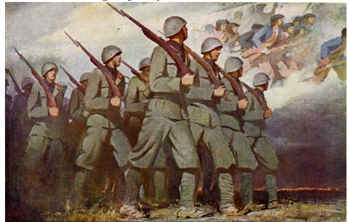
DIVISIONE DI FANTERIA GRANATIERI DI SARDEGNA

Postkarte zur Feier der Division, die an die Pracht des königlichen Garderegiments von Karl Emanuel II. von Savoyen erinnert