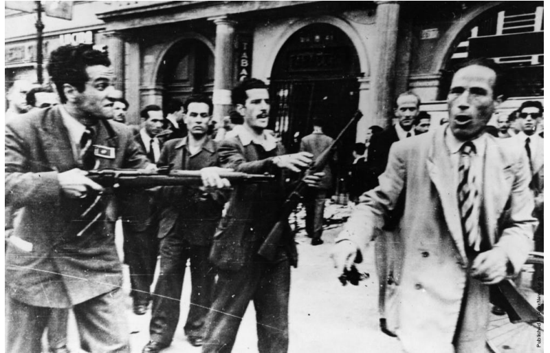
Italienische Partisanen verhaften einen Sympathisanten der Faschisten in Rom, 1944

Pio: Ja, Italien war inzwischen eine Litanei der Politik. Sie hatten eine starke kommunistische Präsenz; sie brachten sogar sowjetische Soldaten und entflohene sowjetische Gefangene zu ihrer Unterstützung mit. Der Durchschnittsitaliener wollte nichts von alledem, er war nicht fanatisch gegenüber dem Duce, aber er wollte ganz sicher nicht, dass Kommunisten das Sagen hatten. Zu uns kamen viele Freiwillige, als die Partisanen Städte überfielen und provisorische Regierungen einsetzten, die alle Faschisten oder Verbündeten Deutschlands bestrafen wollten. Diese Banden setzten Preise für alle Adligen, Faschisten oder Geistlichen aus, die gegen sie sprachen. Wir mussten diese Verbrecher angreifen, wenn sie sich zeigten. Ansonsten versteckten sie sich, so gut es ging, unter dem Volk. Unsere Einheit erhielt immer wieder Hinweise und Warnungen darüber, wo sie sich aufhielten und wer sie anführte. Ich weiß noch von einer Operation, bei der sie das Kind eines Anführers entführten und drohten, es zu töten. Das machten sie oft, sie entführten für Lösegeld und hofften auf einen großen Zahlag. Es gab Gerüchte, dass sie nach Frankreich geflohen waren, das nun vollständig unter alliierter Kontrolle stand. Wir gingen immer noch von Dorf zu Dorf und suchten nach einer Spur, aber wir fanden keine.