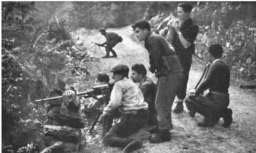
Partisanen liefern sich im Oktober 1944 im Val Formazza nahe der Schweizer Grenze ein Rückzugsgefecht mit den Faschisten. Wer konnte, flüchtete in die Schweiz.

Es war eine unangenehme Angelegenheit, gegen diese so genannten Freiheitskämpfer kämpfen zu müssen; sie waren nichts weiter als Kriminelle und Feiglinge. Wenn man sie erwischte, schrien und weinten die meisten um Mitleid, aber ihre Verbrechen waren schwer zu ignorieren. Viele unschuldige Italiener waren zwischen den Kämpfen gefangen und konnten nicht entkommen. Unser Kommandeur