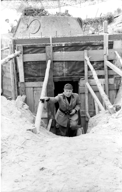
Benito Mussolini inspiziert eine Verteidigungsanlage, Italien, 1944; beachte den Panzer V [Panther]-Turm