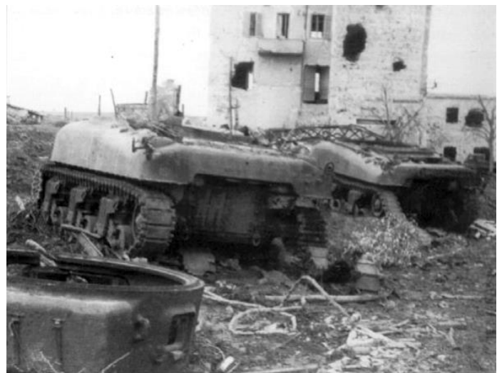
Anzio-Front, Mai 1944. Amerikanischer Sherman zerstört durch die Explosion der Munitionsreserven, die den Geschützturm herausprengte. Zahlreiche italienische SS-Freiwillige fielen bei dem extremen Versuch, die feindlichen Panzer mit Handgranaten und den wenigen Panzerfäusten aufzuhalten.

Ich hatte einen Panzermann aus einem schweren Bataillon getroffen. Er sprach davon, wie gut der neue Tiger sei, aber selbst dieser Panzer könne ausgeschaltet werden, da es nur sehr wenige von ihnen gebe, so dass die Alliierten sich leicht auf sie konzentrieren könnten. Er sprach von vielen neuen Waffen, die kommen würden, und das gab einen Hoffnungsschimmer. Nach meiner Genesung wurde ich als Übersetzer für unseren Kommandanten und den deutschen Kommandeur unseres Sektors eingesetzt. In dieser Rolle blieb ich bis zum Kriegsende und übersetzte Befehle und Diskussionen zwischen Italienisch und Deutsch. Ich lernte einige hinduistische und arabische Soldaten kennen und sprach mit ihnen, um meine Sprachkenntnisse zu verbessern, wir kamen gut miteinander aus. Sie waren sehr fanatisch und starben bereitwillig, ohne auch nur einen Gedanken daran zu verschwenden, was ich bewunderte.