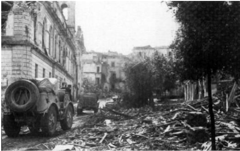
Cisterna, Mai 1944. Ein SPA TM 40 Artillerietraktor im Einsatz bei einer deutschen Einheit, aufgenommen in den Ruinen der Stadt Latium.

verbessern. Ein Großteil unserer Vorräte wurde durch Luftangriffe zerstört, daran kann ich mich noch gut erinnern. Glücklicherweise versorgten uns die Zivilisten mit Nahrung, wenn die Rationen nur langsam bei uns ankamen. Ich war beeindruckt von der Menge an Material, die allein die Amerikaner aufbringen konnten. Als mein Bataillon an der Front ankam, überblickten wir unseren Sektor; ich kletterte auf einen Hügel und konnte die riesige Armada sehen, die sie hatten. Wir brachten zahlreiche Artilleriegeschütze auf, um sie zu beschießen, aber die Nachschubfahrzeuge hatten Schwierigkeiten, sie mit Granaten zu versorgen. Wie immer war es zu wenig und zu knapp für uns.