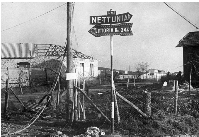
Straßenschild im Bereich der Kampfhandlungen an der Front bei Nettuno, Februar 1944

Die Briten waren jedoch Profis in dieser Art der Kriegsführung. Sie ließen Hunderte von Arabern als Spione hinrichten, erließen strenge Gesetze, um die Fatwa zu stoppen, und schickten viele in Lager, um Sabotageakte zu verhindern. Sie benutzten Nahrung und Wasser, um große Bevölkerungsgruppen zu kontrollieren und ihren Gehorsam zu erzwingen. Als Afrika verloren war, kam ich nach Hause, aber Italien wurde von Kommunisten übernommen, die die Antikriegsstimmung nutzten, um die Menschen zu täuschen. Ähnlich wie es 1918 mit Deutschland geschah. Italien hatte große Verluste erlitten, und die Gefahr, dass Bomben die Städte zerstören würden, veranlasste viele, uns zuzustimmen, dass wir aussteigen mussten. Viele andere jedoch sahen diesen Kampf als das, was er war: ein tieferer Kampf zwischen Gut und Böse, der einen endgültigen Ausgang haben musste. Als der Waffenstillstand verkündet wurde, bat ich deutsche Verbündete um Hilfe und man riet mir, eine große Anzahl kampfbereiter Männer aus meinem Regiment mit herüberzubringen.