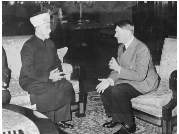
Am 28. November 1941 wurde der Großmufti von Palästina zu einer herzlichen und für die Zukunft der arabischen Länder bedeutungsvollen Unterredung von Reichskanzler Hitler in Gegenwart des Reichsministers des Auswärtigen Joachim von Ribbentrop empfangen.