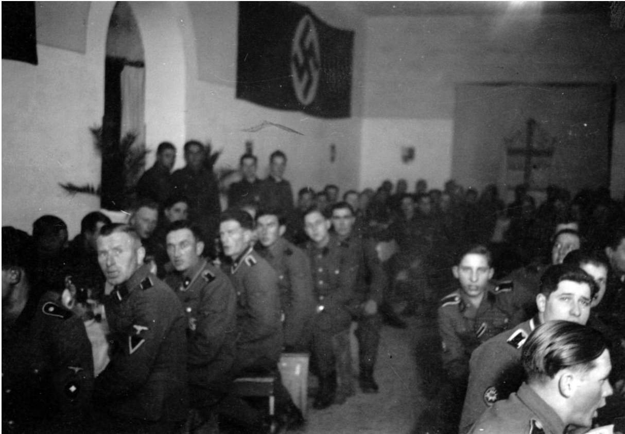
Gradisca, Dezember 1943, 'Es wurde ganz dunkel und es gab den Baum und eine Kerze für jeden Gefallenen'.

Wissenschaftler der Gesellschaft für Ahnenerbe, die viele meiner Interessen teilten und nie auf Italiener herabblickten. Ich schenke der Vorstellung, dass die Deutschen pangermanisch waren und alle anderen hassten, wenig Beachtung. Ihre Handlungen in Bezug auf diese Zusammenarbeit verraten ihre wahre Gesinnung.